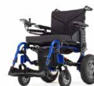
Esprit Action 4 - Versão Adulto