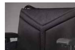
Novo tecido de Encosto